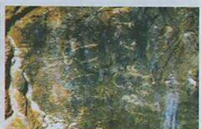
Pictografías de aves La Cueva de la Colmena