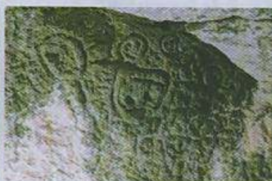
Petroglifos del Guanál (detalles)