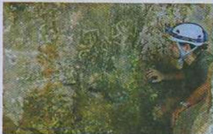
Petroglifos de La Cueva de la Colmena

La representación plasmada en la roca asemeja un personaje probablemente femenino cuya mirada domina toda la línea de arena. Este petroglifo es de gran