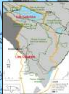
Figura 1. Mapa representando la zona de estudio, la cual incluye la isla Cabritos y la zona de Los Olivares, la cual incluye los 4 fondos de estudio: Abajo, Cyclura ricordi en isla Cabritos.

En este trabajo, presentamos los resultados del primer estimado de densidades poblacionales hecho de manera sistemática en dos de las tres áreas de distribución actual de C. ricordi en R.D. como primer paso en una evaluación que abarcará todas las áreas de ocupación actuales.