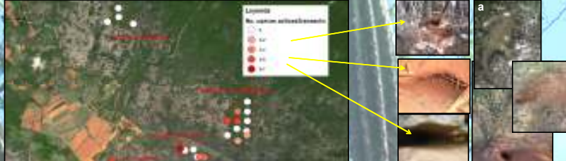
Figura 4. Izquierda: los puntos señalan la posición de cada transecto realizado y el color el número de cuevas activas reportadas para cada transecto para C. ricordi en los Olivares en enero 2011; derecha: imágenes de cuevas activas en Pedernales y un avistamiento de una C. cornuta en el Fondo de la Malagueta (a).