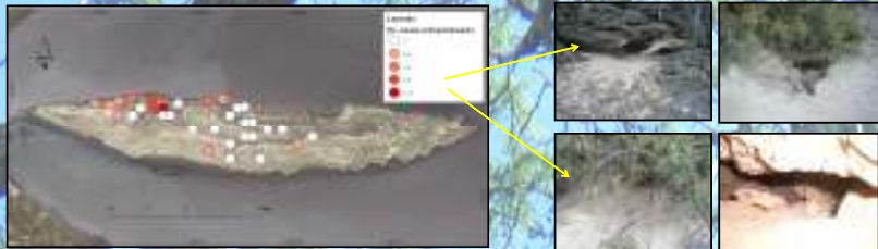
Figura 2. Izquierda: los puntos señalan la posición de cada transecto realizado y el color el número de cuevas activas reportadas para cada transecto para C. ricordi y cornuta en isla Cabritos en noviembre 2010; derecha: imágenes de cuevas activas en isla Cabritos.

Finalmente, todos los avistamientos de animales hechos dentro y fuera de transectos fueron registrados con la especie y georeferenciados.