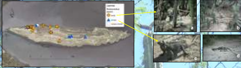
Figura 3. Izquierda: avistamientos reportados para cada una de las especies de Cyclura en isla Cabritos en noviembre 2010; derecha: imágenes de C. ricordi (a y b) y de C. cornuta (c y d) en isla Cabritos.